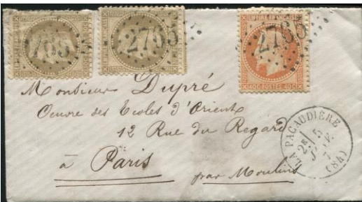
Voorbeeld van brief

Het geheel werd eigenlijk een groot fiasco. Enkele boules-de-moulins konden echter pas worden teruggevonden na het einde van het beleg. De eerste werd in maart 1871 teruggevonden in Les Andelys . Het lijkt er echter op dat er voor die datum één bol is teruggevonden, want er is een brief bekend met zijn aankomststempel in Parijs van 12 februari 1871 (verkoop aangeboden door een Parijse postzegelhandelaar, juni 2014). Uiteindelijk werden ongeveer 25 tot 30 bollen gevonden, de meeste vóór 1910. Maar één werd gevonden in 1942, een andere in 1952. Meer recentelijk werd een bol opgehaald door een baggermachine. In Saint-Wandrille ( Seine -Maritime ) op 8 augustus 1968. Een andere bol werd geborgen in Vatteville-la-Rue ( Seine-Maritime ) in 1982, en nog een in 1988. Elke keer probeert de postdienst de brieven te bezorgen aan de afstammelingen van de oorspronkelijke ontvangers volgens het principe dat “de postbezorgingsmissie geen tijdslimiet heeft “. Van de 55 verzonden bollen blijven er dus een twintigtal vastzitten op de bodem van de Seine en kunnen de komende jaren weer boven water komen . Maar de locatie van de laatste vondsten (stroomafwaarts van Rouen) suggereert dat de bollen die nog ontdekt moeten worden, mogelijk aanzienlijk van Parijs zijn verwijderd of zelfs bij het Kanaal zijn gekomen.