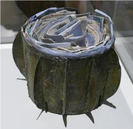
Een Boule-de-Moulins (dummy) Postmuseum Parijs)

Een « Boule de Moulins » (Duits: Zinkkugel) was een methode om post naar de stad Parijs te vervoeren tijdens de belegering van de stad tijdens de Frans-Duitse oorlog van 1870-1871.. Omdat de post met deze kogels gecentraliseerd was in Moulins ( Allier ), werden deze zinken bollen "de Moulins" genoemd.