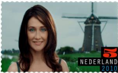
Carice van Houten

De bekendste Leiderdorper is de actrice Carice van Houten. Zij werd op 5 september 1976 in Leiderdorp geboren. Haar vader is de Nederlands-Schotse schrijver, musicoloog en filmhistoricus Theodore van Houten. Carice is vernoemd naar de enige dochter van de Britse componist Edward Elgar: Carice Irene (1890–1970). Vader Theodore had een fascinatie voor deze componist. Hij nam zijn dochter regelmatig mee naar musea, theatervoorstellingen en films uit de klassieke cinema. Carice van Houten komen we tegen op een bijzondere Nederlandse postzegel met bewegend beeld.