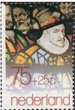
Willem van Oranje

“opgetrommeld” en bij de soldaten van Prins Willem van Oranje ging dat met de trompet.